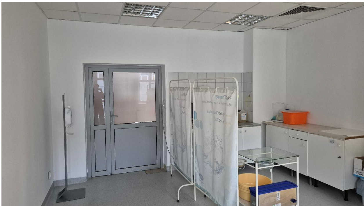
Fotografia 6. Pomieszczenie 1.13 – wejście na blok