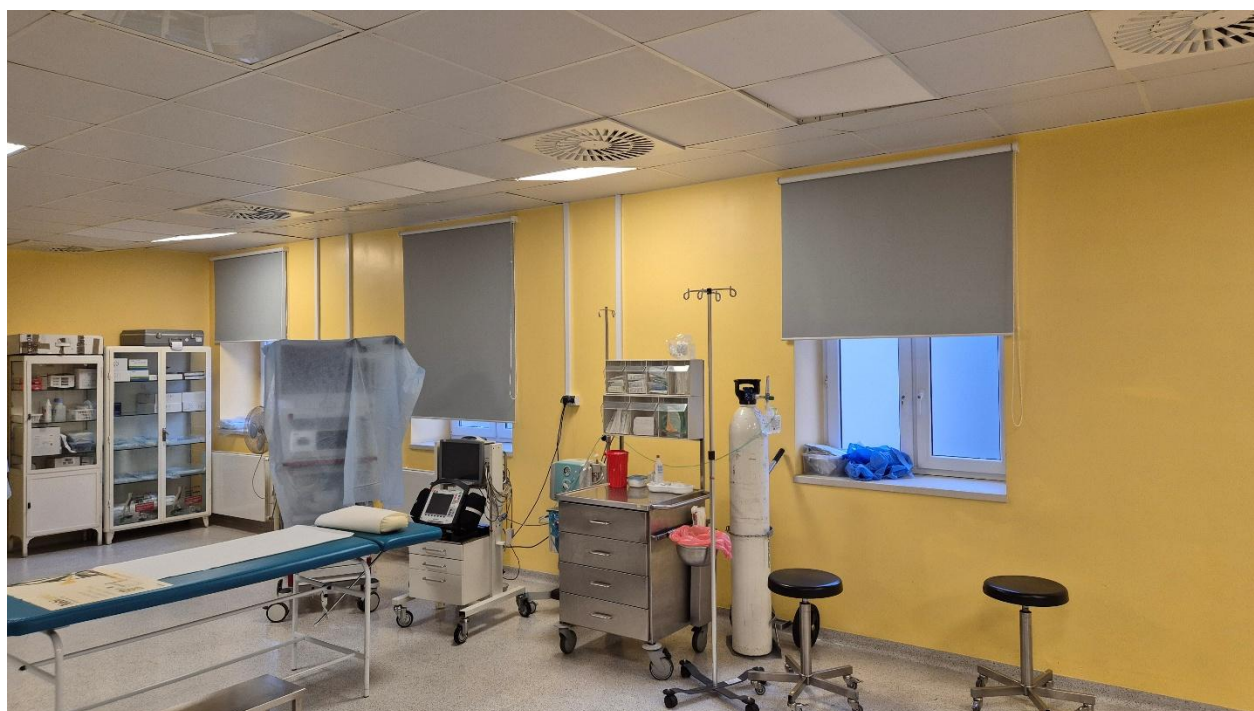
Fotografia 4. Pomieszczenie 1.12 – układ ściany zewnętrznej