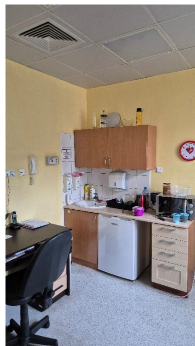
Fotografia 12. Pomieszczenie 1.08 – Pomieszczenie socjalne