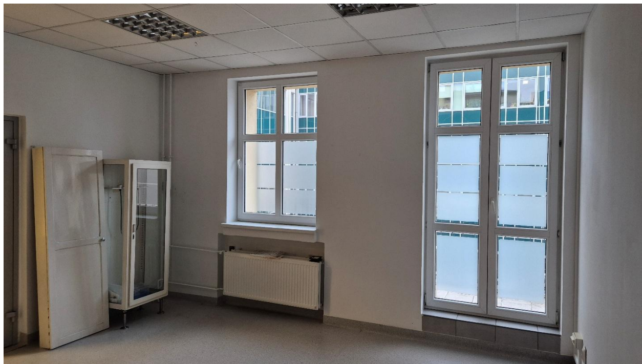
Fotografia 7. Pomieszczenie 1.13 – wyjście na balkon