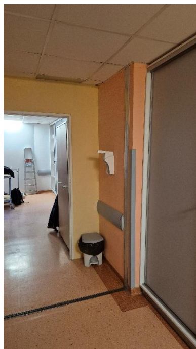
Fotografia 14. Pomieszczenie 1.04 – Korytarz z zabudową – dalsza część