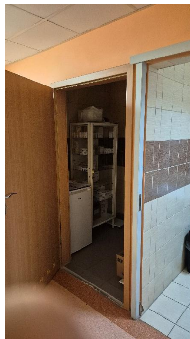
Fotografia 15. Pomieszczenie 1.04 – Widok na przestrzeń magazynową