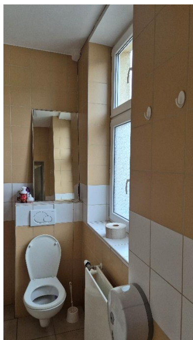
Fotografia 13. Pomieszczenie 1.07 – Łazienka