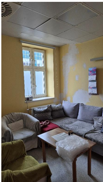
Fotografia 10. Pomieszczenie 1.08 – Pomieszczenie socjalne