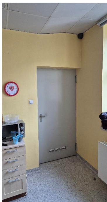
Fotografia 11. Pomieszczenie 1.08 – Pomieszczenie socjalne