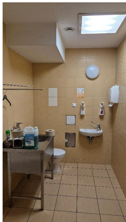
Fotografia 8. Pomieszczenie 1.10 – łazienka