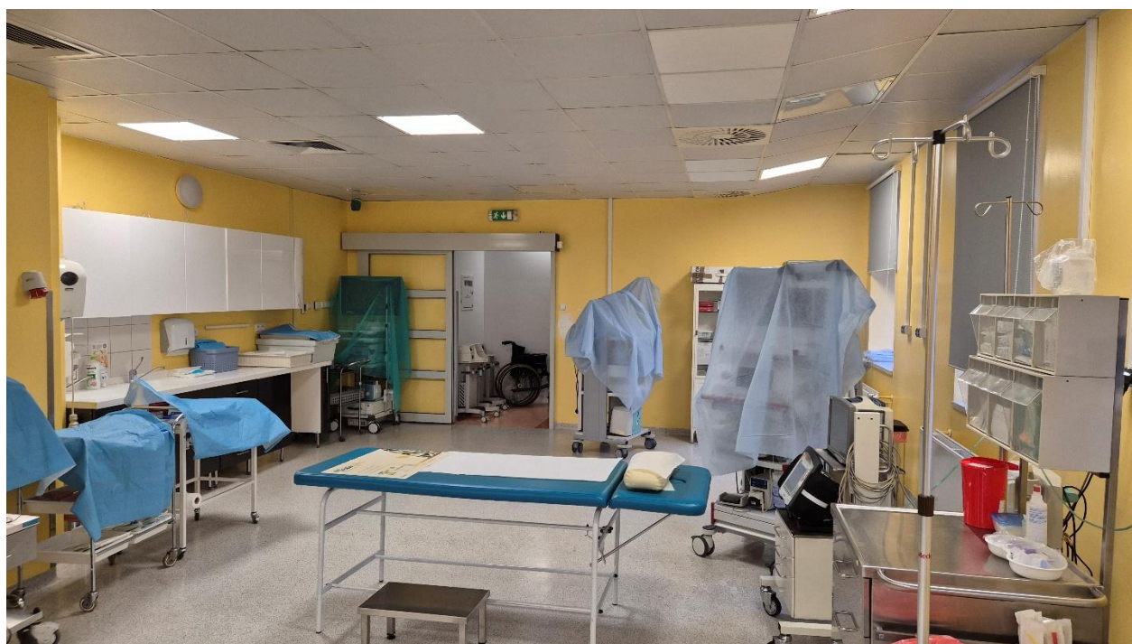
Fotografia 3. Pomieszczenie 1.12 – układ pomieszczenia