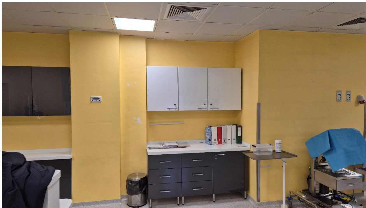
Fotografia 2. Pomieszczenie 1.12 – tektonika ściany wewnętrznej