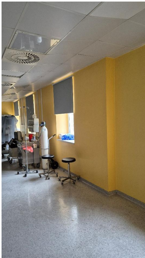
Fotografia 5. Pomieszczenie 1.12 – uskok w suficie i ścianie zewnętrznej