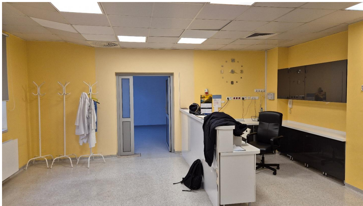
Fotografia 1. Pomieszczenie 1.12 – wejście na oddział